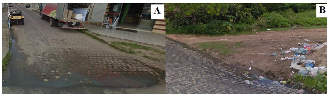
Figura 1: Lançamento irregular do esgoto no município de Parnamirim-RN. A) Cruzamento de ruas no bairro Rosa dos Ventos; B) Rua Pedro David Norzinho.

No que diz respeito ao sistema de esgoto de Parnamirim, segundo o SNIS (2019), a coleta e tratamento de esgoto atendia até 5,5% dos imóveis em 2018. Os imóveis não atendidos pelo sistema tinham solução individual, como fossas e sumidouros, ou direcionavam o esgoto aos corpos hídricos ou ruas, correndo a céu aberto (Figura 1).